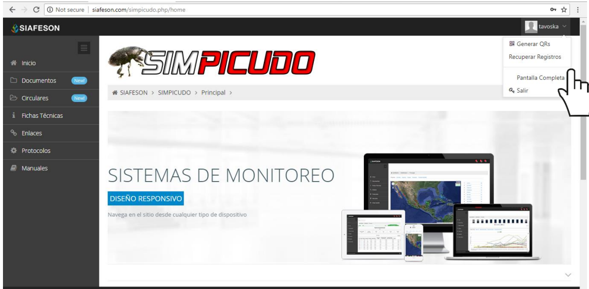
Fig. 8. Ubicación del enlace para acceder al módulo para recuperar registros.

Para esta acción es necesario ingresar al módulo que se muestra como recuperar registros, la ubicación se localiza en el menú de navegación del sistema.