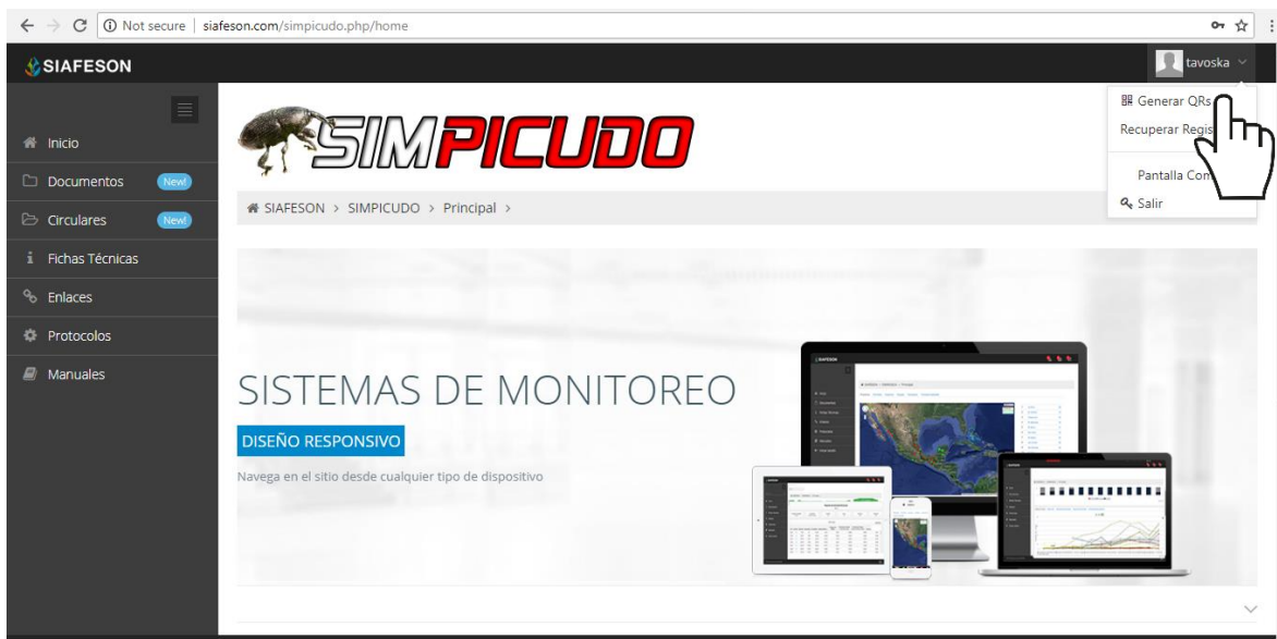
Fig. 4. Ubicación del enlace para acceder al módulo para la generación de QRs.

Para poder generar los códigos QR es preciso ingresar a la sección que se visualiza como Generar QRs, este se encuentra ubicado dentro del menú de navegación disponible tal como se visualiza a continuación en la figura 4.