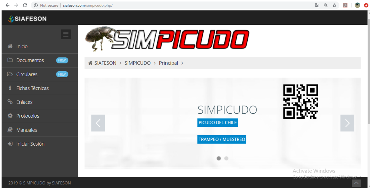
Fig. 1. Pantalla principal del sistema web publico SIMPICUDO.