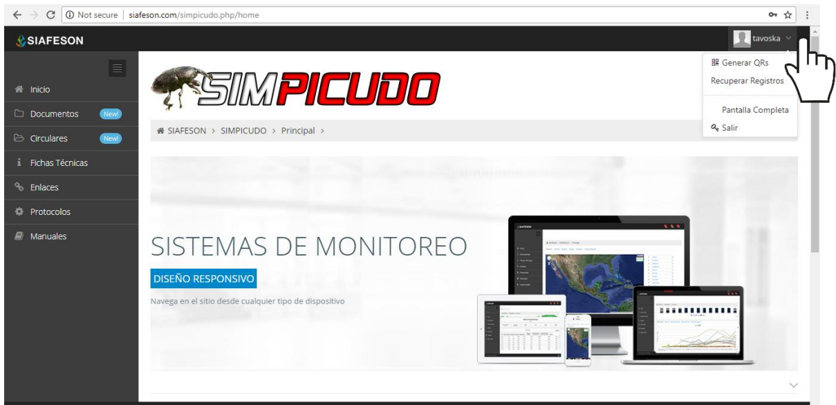
Fig. 3. Localización de las funciones principales del sistema web privado.

Si seguiste los pasos descritos anteriormente, el sistema web se encuentra listo para usarse y poder así comenzar con la captura de registros y envió de información.